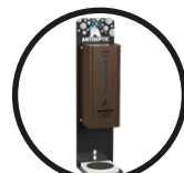
.TCH TITANIUM CHOCOLATE