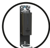
.TB TITANIUM BLACK