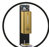
.TG TITANIUM GOLD