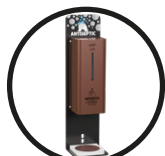
.TCO TITANIUM COPPER