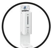
.W WHITE (RAL 9016)