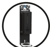
.B BLACK (RAL9005)